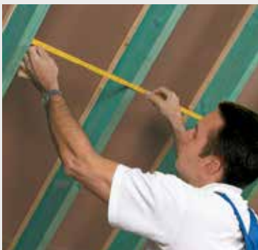
Fig. 1 Meet de ruimte tussen 2 kepers en voeg hier 1 à 2 cm aan toe. Mesurez la distance entre 2 chevrons et ajoutez-y 1 à 2 cm.

L'application d'un pare-vent/vapeur est indispensable pour assurer l'étanchéité à l'air et à la vapeur d'eau (fig.4). Le pare-vapeur à base de polyamide au pouvoir asséchant est décrit dans la fiche ISOVER vario® KM duplex.