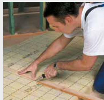
Fig. 2 Snij de gewenste breedte langs de maatstrepen af met een lat en het ISOVER isolatiemes.

A l'aide du couteau ISOVER coupe laine et d'une latte, coupez à dimension en suivant les prémarquages.