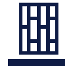
Onder houtachtige vloeren